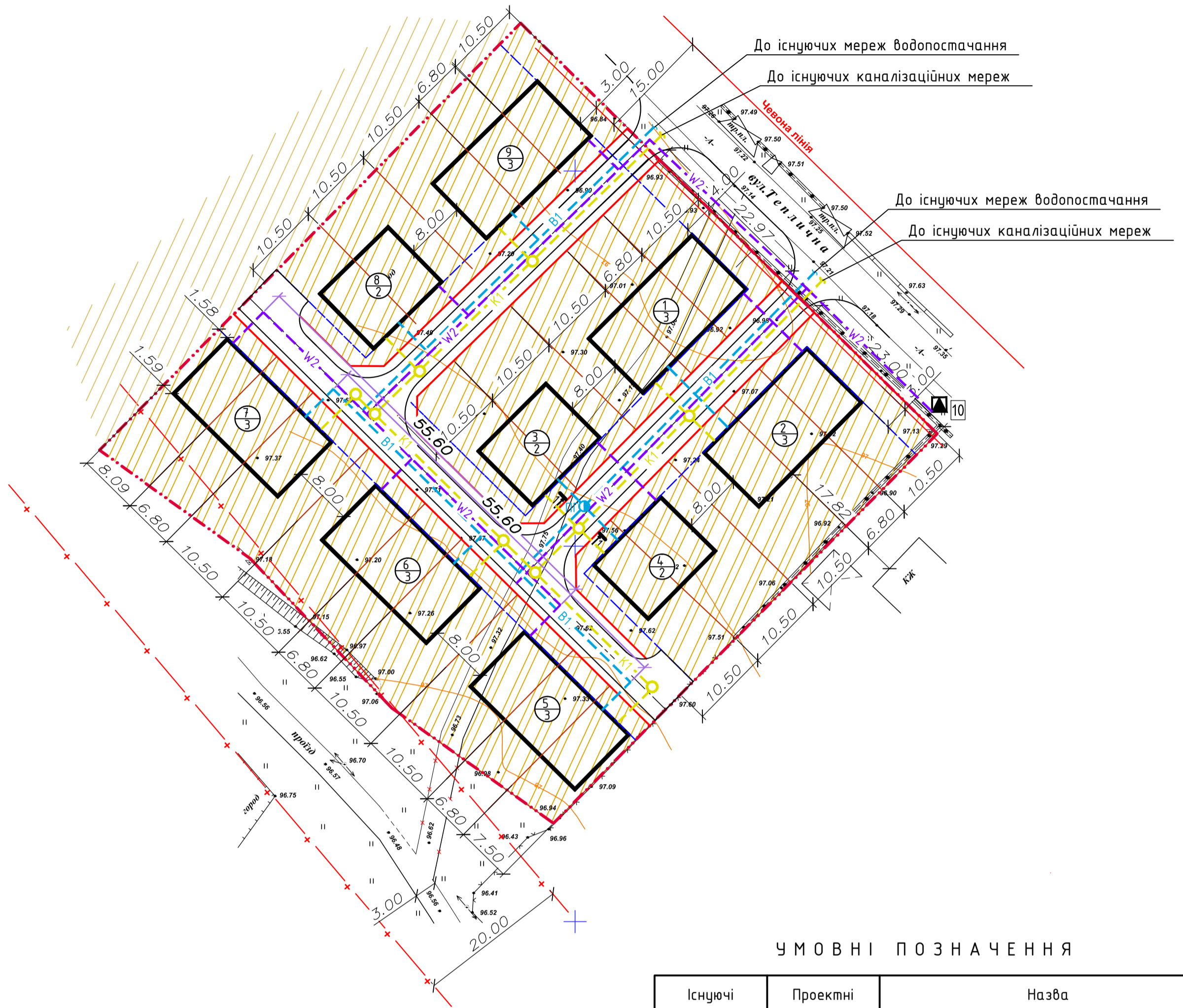
Схема інженерних мереж М 1:500

земельної ділянки в с.Погреби Зазимської сільської ради, Броварського району, Київської області