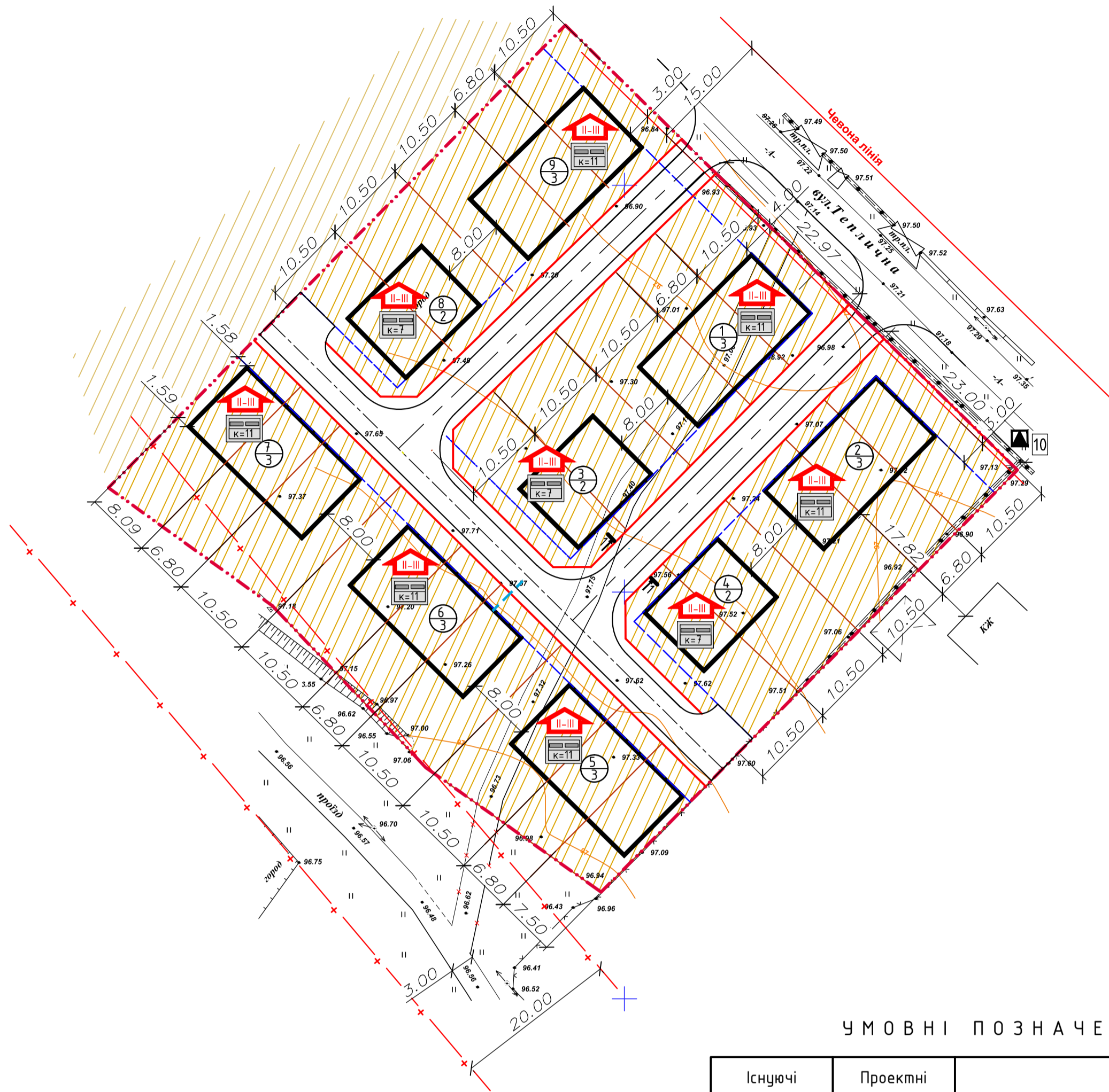
Схема інженерно-технічних заходів цивільного захисту (цивільної оборони) М 1:500

земельної ділянки в с.Погреби Зазимської сільської ради, Броварського району, Київської області