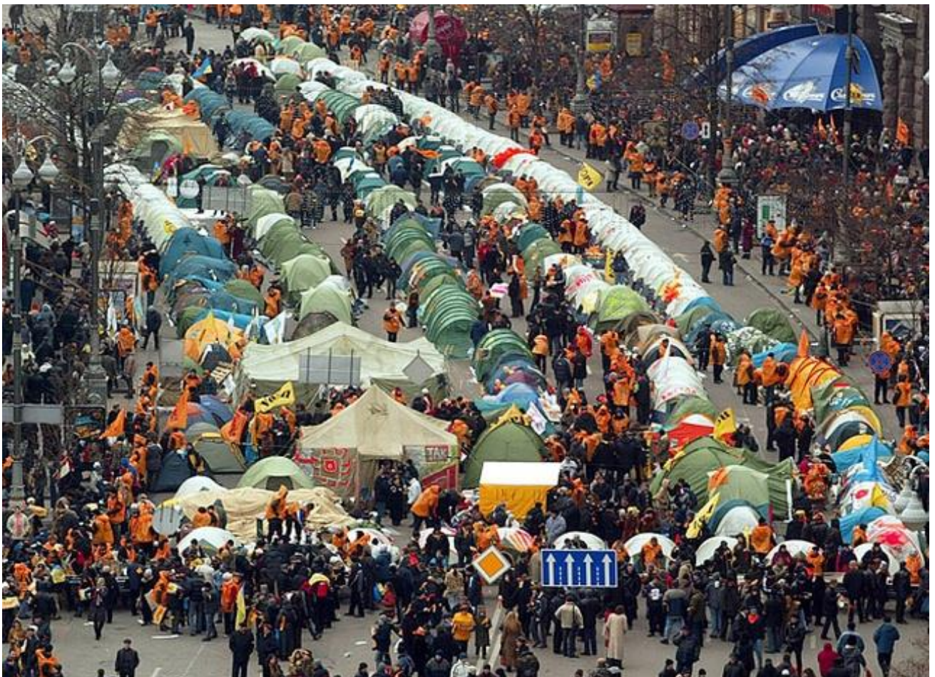
Наметове містечко у середмісті Києва.

22 листопада о 4-й годині ранку протестувальники почали встановлювати намети. Протягом наступної доби наметове містечко розрослося приблизно до 400 наметів, розміщених по всьому Хрещатику аж до Бессарабської площі. Навколо містечка встановили огорожу. Штаб Віктора Ющенка організував пряму супутникову трансляцію з Майдану, чим одразу скористалися провідні світові телеканали. Панорама київського Майдану потрапила в поле зору багатьох країн світу.