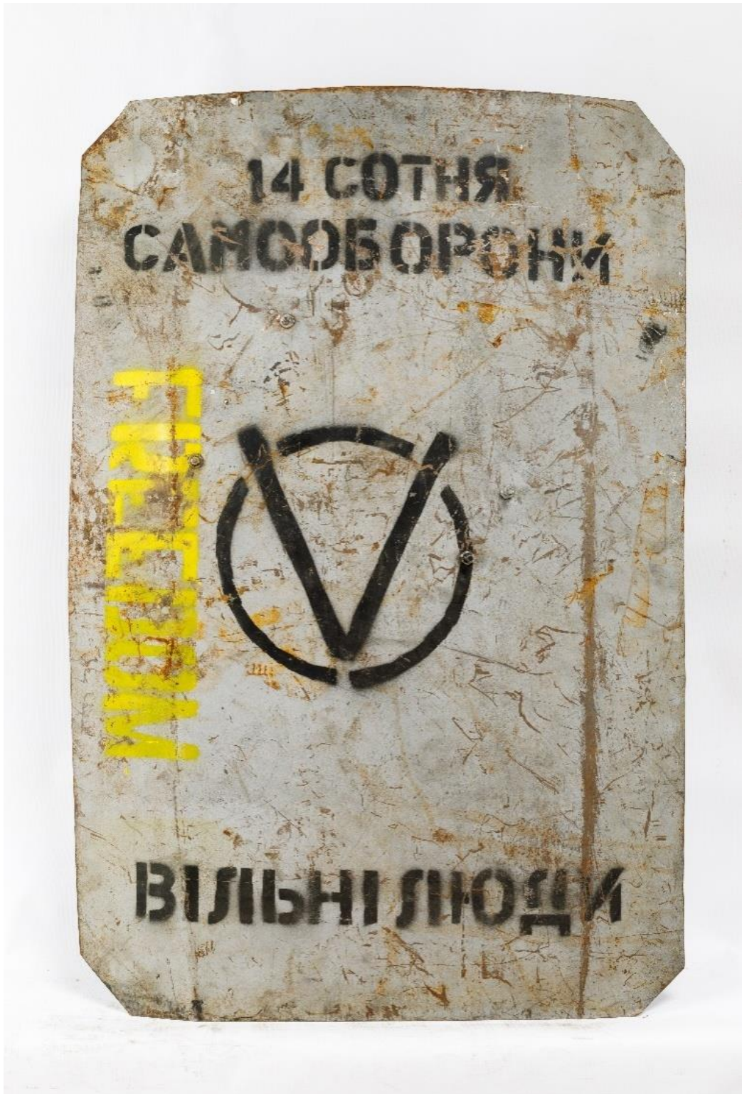
Щит члена 14-ї сотні Самооборони Майдану.

звільнити від протестувальників майданчик поблизу будівлі палацу, відкривши вогонь на ураження.