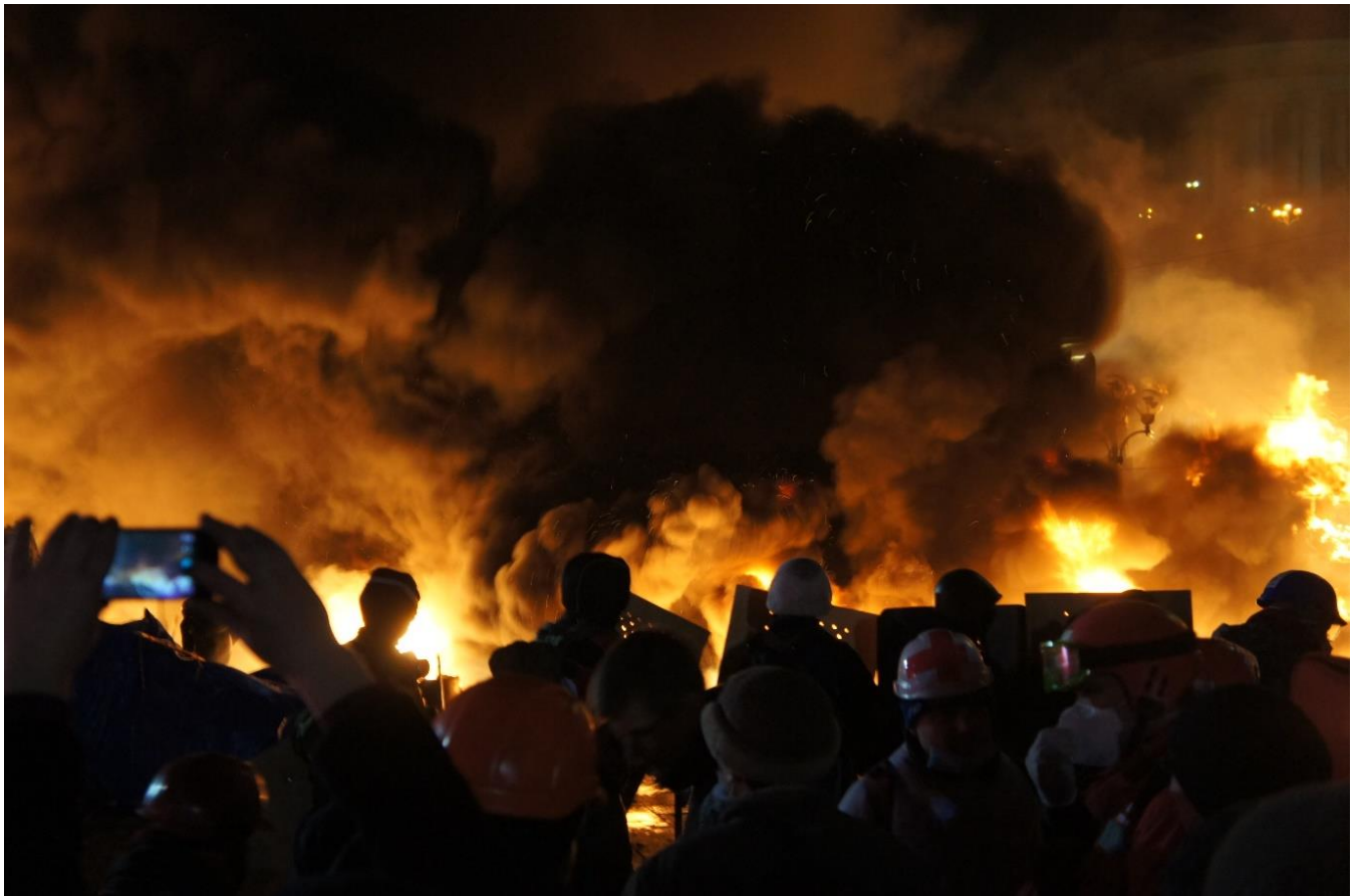
Оборона Майдану. Ніч проти 19 лютого 2014 року.

Того самого дня голова СБУ Олександр Якименко оголосив про початок проведення «антитерористичної операції», звинувативши учасників акцій протесту у вандалізмі, мародерстві, вбивствах, захопленні держустанов та зброї. Однак цю заяву було засуджено не лише лідерами демократичного світу та опозиційними політиками, а й деякими поплічниками Януковича. Ближче до вечора СБУ спростувала інформацію про початок антитерористичної операції. Почалися переговори лідерів опозиції з В. Януковичем, після яких було оголошено перемир'я.