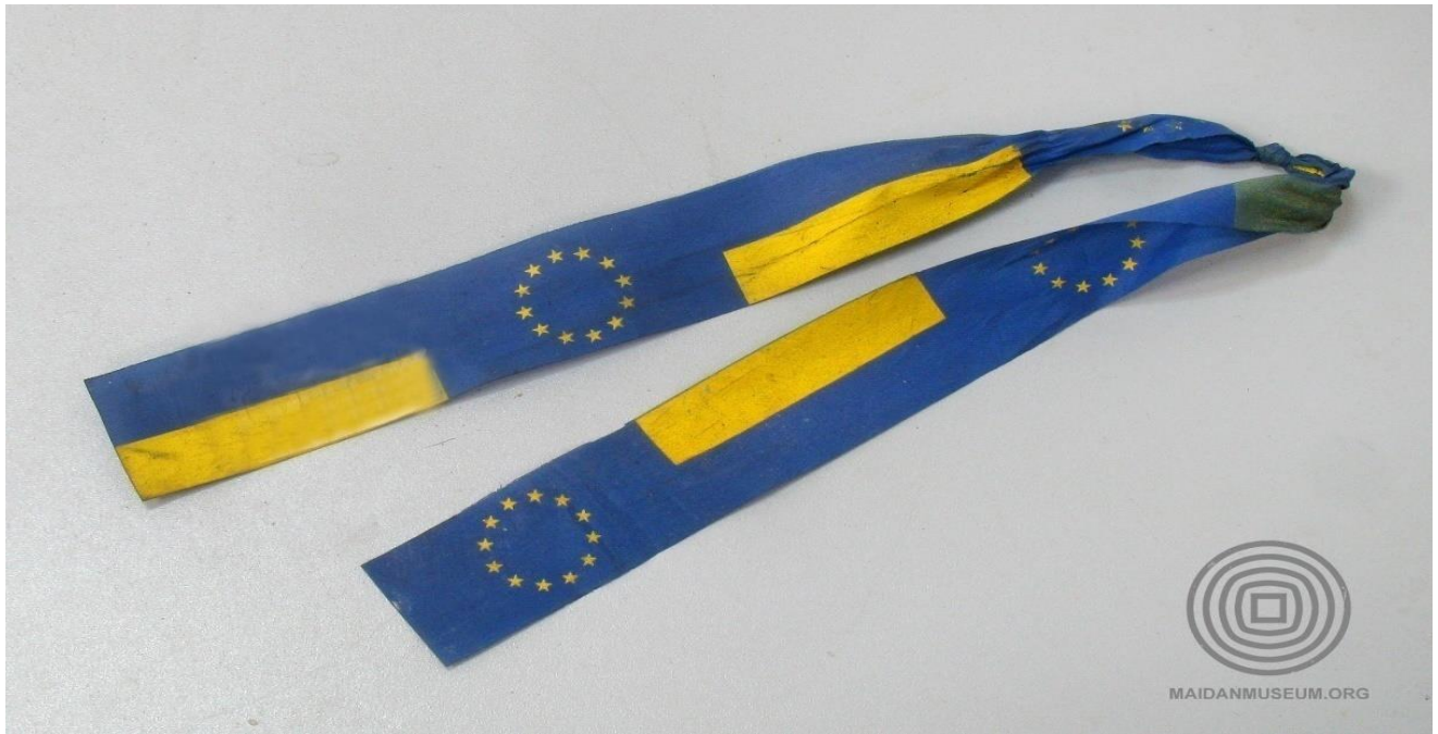
Стрічка із символікою Євросоюзу та кольорами прапора України.

Під час сутичок із силовиками – спочатку на вулиці Михайла Грушевського, а потім і на самому майдані Незалежності – символами активних протестів стали пляшки з «коктейлем Молотова», бруківка та шини , підпалюючи які протестувальники створювали вогняний кордон і димову завісу, що закривала їх від бійців МВС.