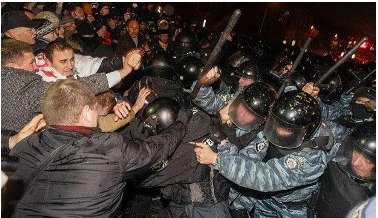
Побиття мітингувальників біля монумента Незалежності у ніч на 30 листопада 2013 року.

Офіційною причиною розгону Євромайдану назвали підготовчі роботи з установлення традиційної новорічної ялинки в центрі Києва.