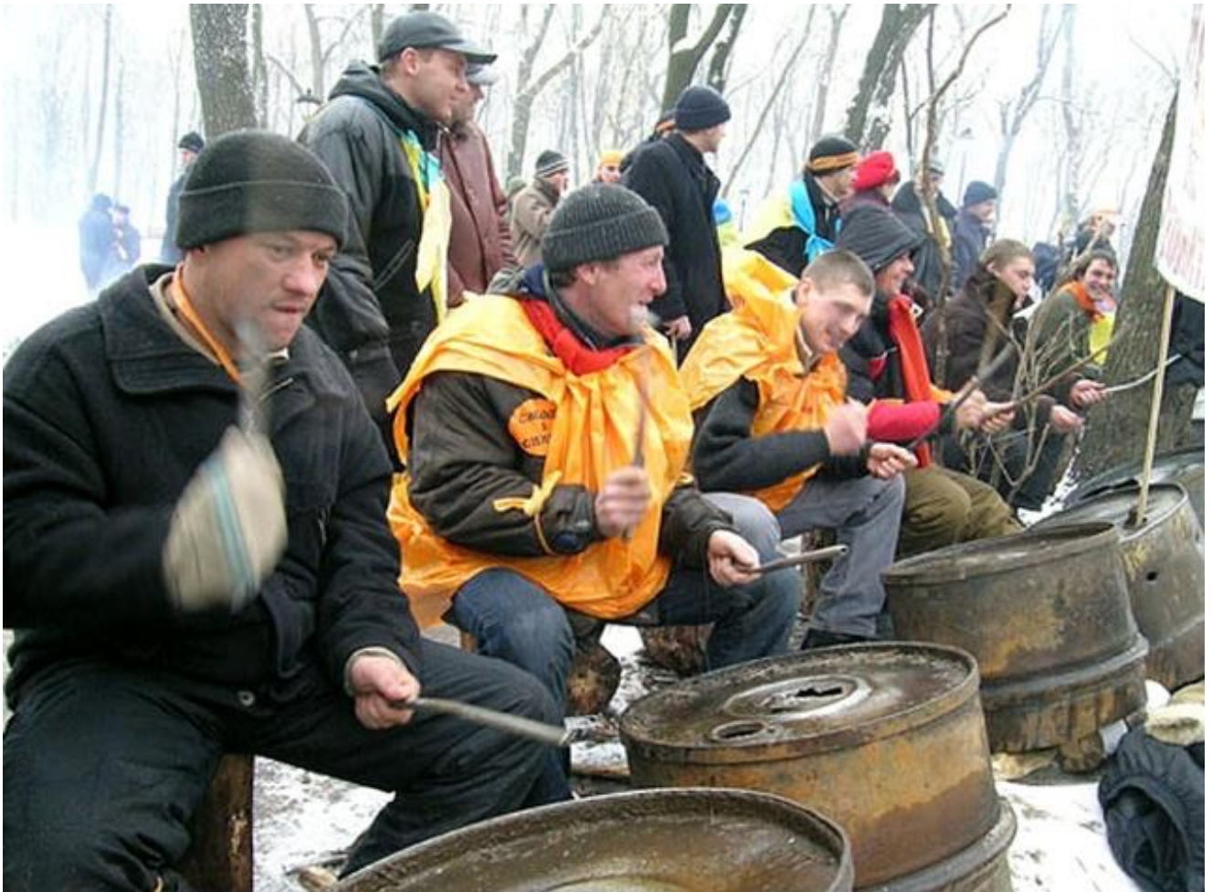
Барабанщики Помаранчевої революції.

Оригінальним виявом творчого духу Майдану стали «барабанщики революції» – група людей, які навпроти будівлі Кабінету Міністрів України стукали в металеві бочки, що залишилися в Маріїнському парку після мітингів прихильників Януковича.