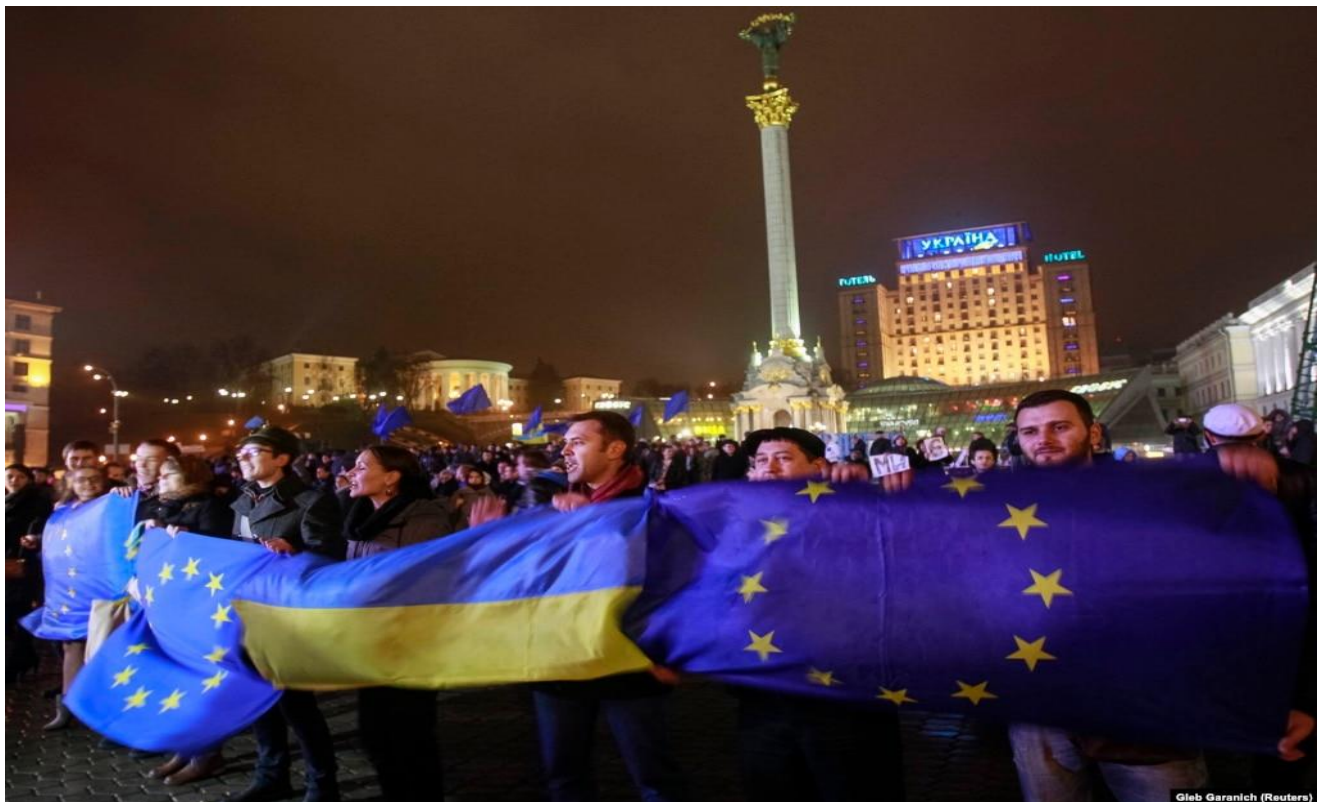
Мітинг на майдані Незалежності 21 листопада 2013 року на підтримку підписання Угоди про асоціацію з ЄС.

У ніч на 22 та вдень 22 листопада протестні акції розпочалися у Харкові, Хмельницькому, Житомирі, Миколаєві, Одесі, Рівному, Кіровограді, Сумах, Луганську, Чернівцях, Черкасах, Чернігові.