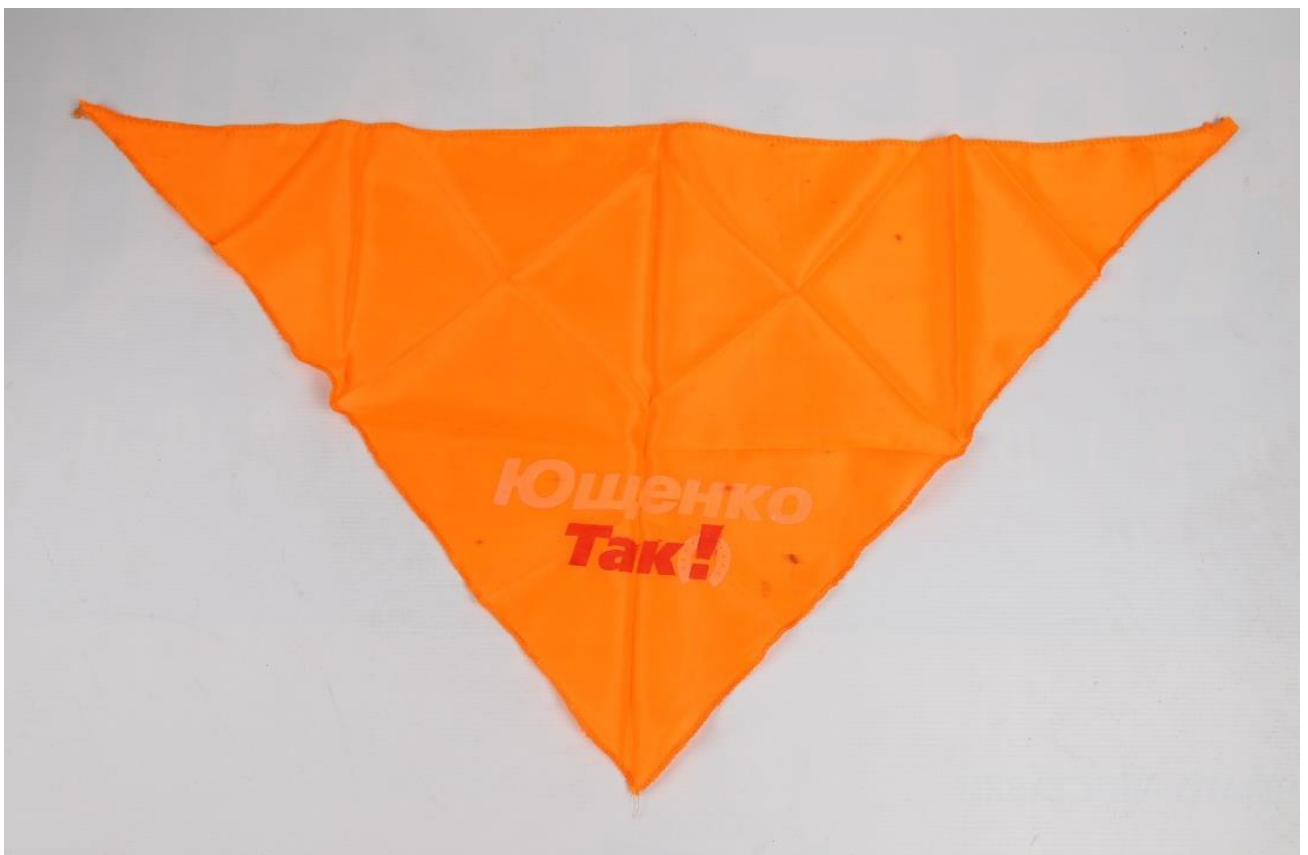
Хустина учасника Помаранчевої революції.

Окрім стрічок, з інших атрибутів помаранчевого Майдану використовували помаранчеві прапори з логотипом партії «Наша Україна» у вигляді підкови зі знаком оклику й написом «Так», наліпки, плакати, а також елементи одягу помаранчевого кольору: накидки (дощовики), хустки, шарфи тощо.