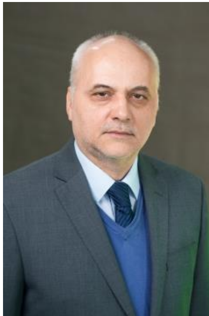
Марек Мельник, релігієзнавець, професор Вармінсько-Мазурського університету (Ольштин, Польща).

Певний час після Євромайдану західний світ тримався осторонь подій, які відбувалися в Україні. Лише російсько-українська війна в її гострій фазі, що почалася 24 лютого 2022 року, й передусім отой спротив, який чинять не тільки українські військовики, а й цивільне населення, змусили демократичні суспільства та уряди усвідомити важливість України для майбутнього Європи.