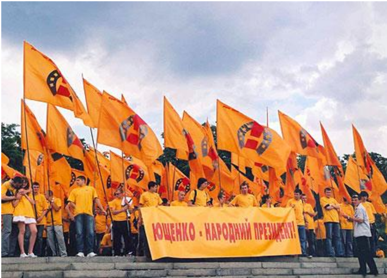
Учасники передвиборчої кампанії на підтримку кандидата в президенти Віктора Ющенка.