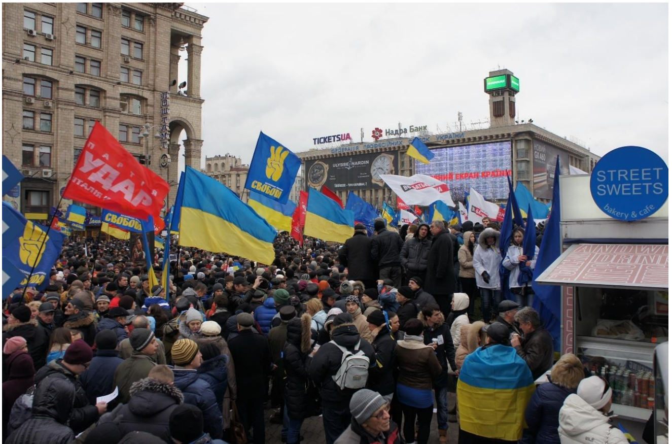
* Мітинг на майдані Незалежності 1 грудня 2013 року.

На вулиці Банковій неподалік від Адміністрації президента відбулися сутички між мітингарями та «Беркутом», під час яких потерпіли зокрема українські та іноземні журналісти.