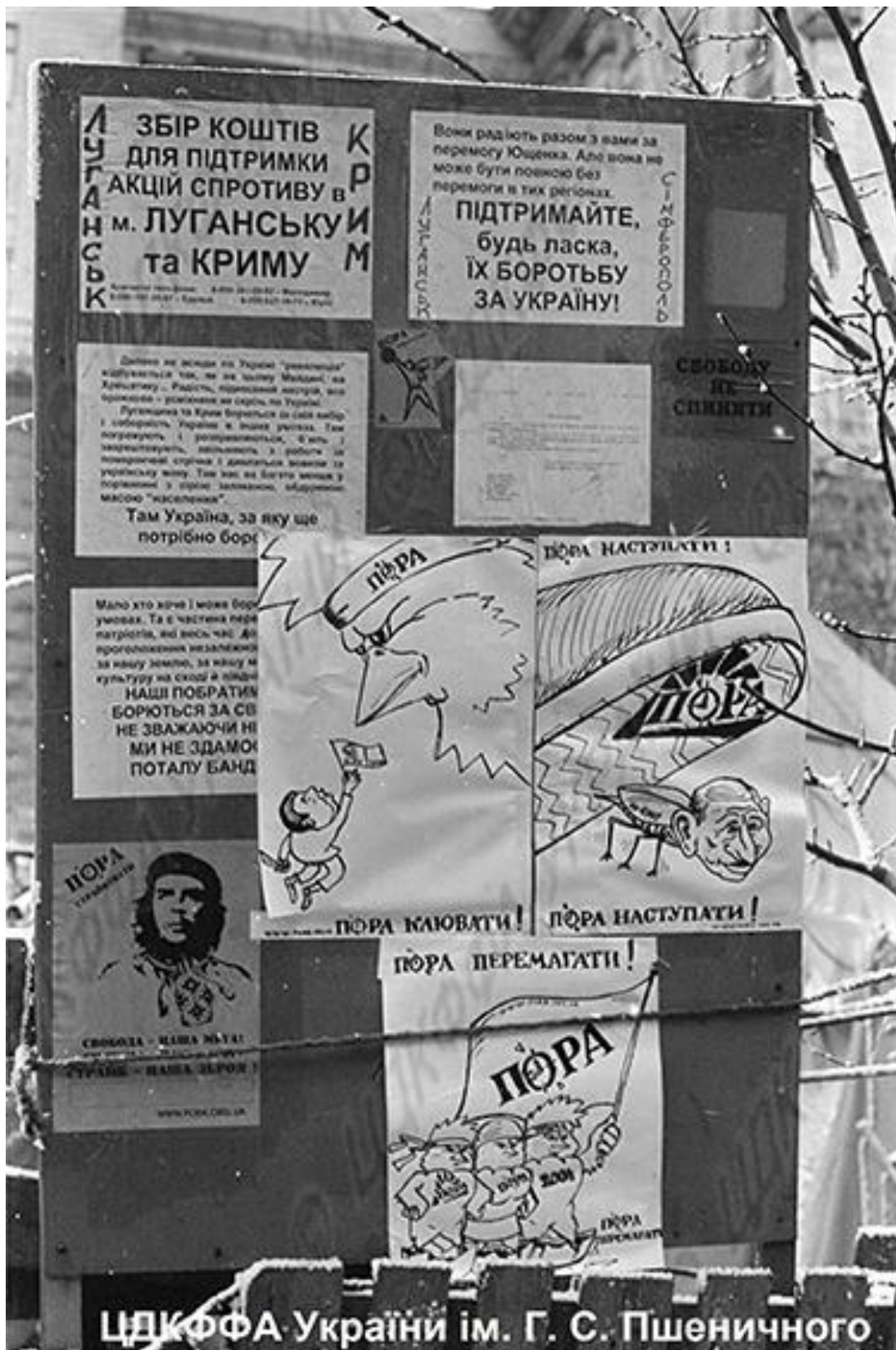
Агітаційні листівки на майдані Незалежності під час Помаранчевої революції. Київ, листопад 2004 року.