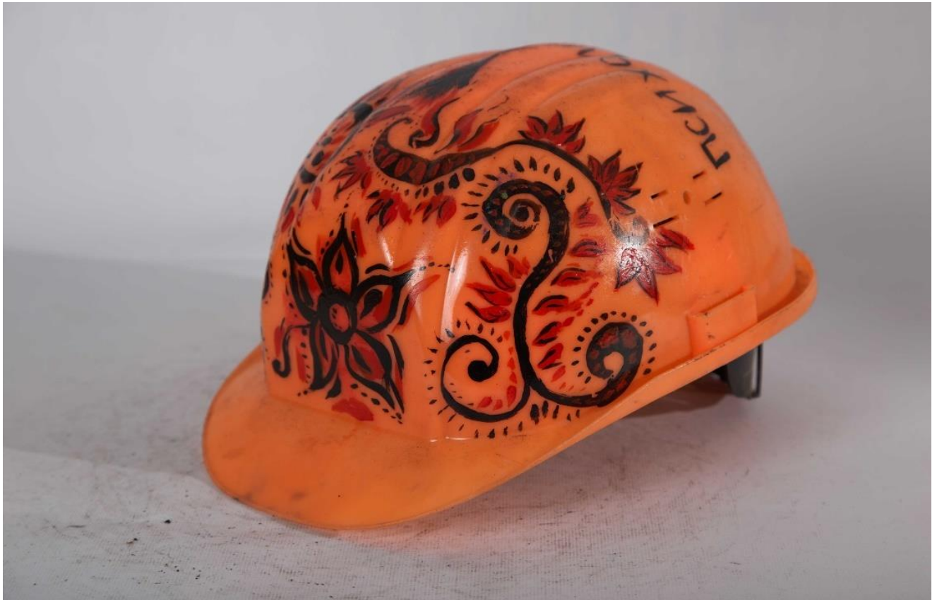
Каска волонтера психологічної служби Майдану.

Символом Майдану стала конструкція новорічної ялинки, встановлена на головній площі столиці. Майданівці називали її « йолкою ». Ставши формальною причиною побиття людей у ніч на 30 листопада 2013 року, згодом вона перетворилася на один із головних символів протесту. Мітингарі прикрасили її прапорами, плакатами, банерами тощо.